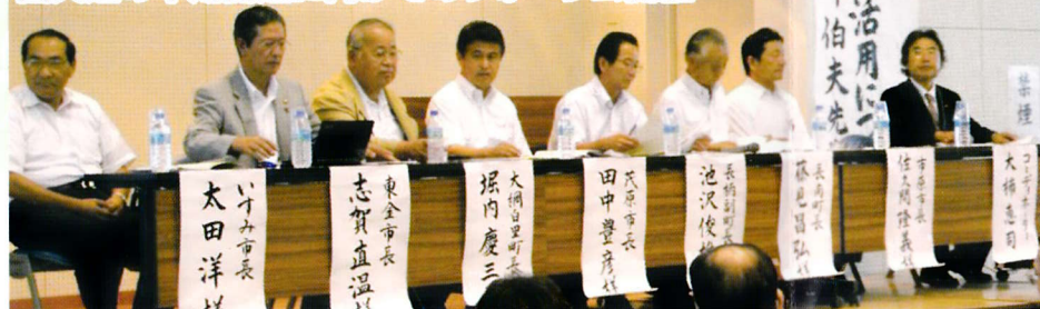
圏央道の早期開通に向けてのフォーラム開催