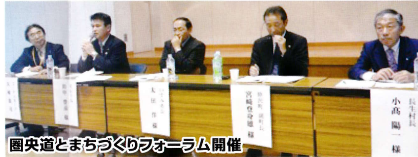
圏央道とまちづくりフォーラム開催