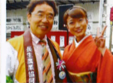
JA長生ふれあい感謝祭